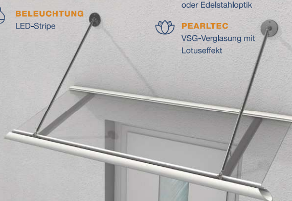
MENORCA II VSG