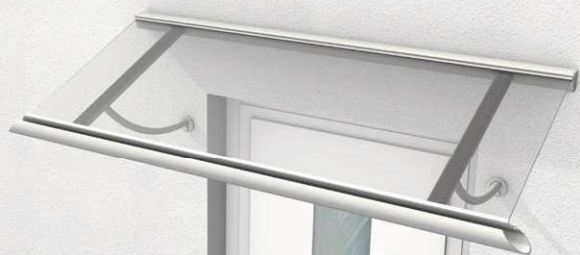
MENORCA I VSG