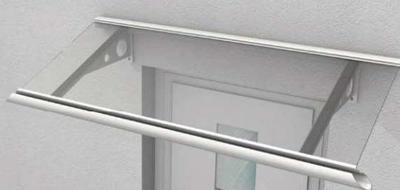
MENORCA III VSG