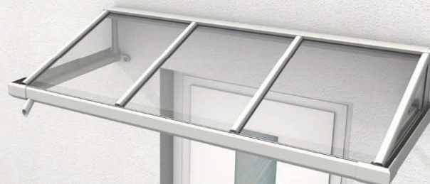
HELGOLAND II ACRYL