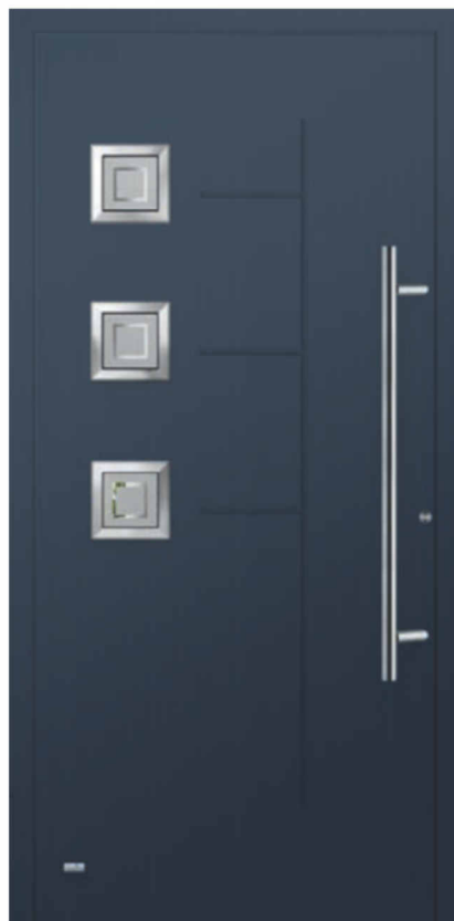
Modell Monaco Oberfläche mit gefrästen Nuten Füllung aufgesetzt Glas: 1G030 Float teilmattiert Griff: AG100 1000mm