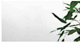
Glas - Float (Klarglas)