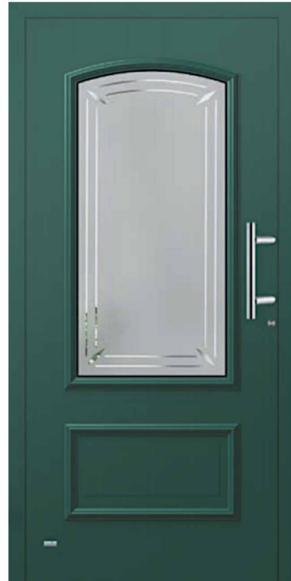
Modell Kopenhagen Oberfläche mit Dekorrahmen Füllung aufgesetzt Glas 6G013 Float teilmattiert Griff AG33 330mm