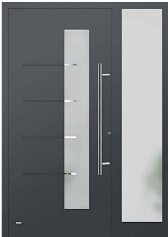
Modell: Nizza mit Seitenteil Oberfläche mit gefrästen Nuten Füllung aufgesetzt Glas 3G040 Float teilmattiert (Motiv) Griff: AG100 1000mm