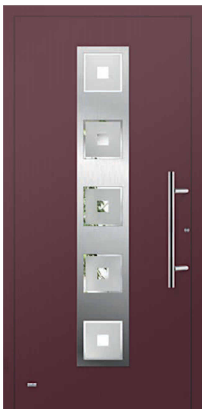
Modell Zürich glatte Oberfläche Füllung aufgesetzt Glas 2G002 Float teilmattiert Griff: AG60 600mm