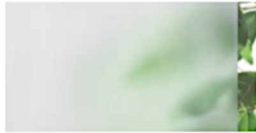
Glas - Satinato weiß