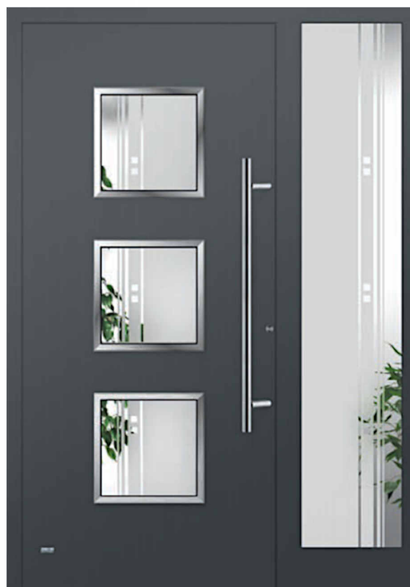
Modell Sevilla mit Seitenteil glatte Oberfläche, Füllung aufgesetzt Glas 1G008 Float teilmattiert Griff: AG100 1000mm