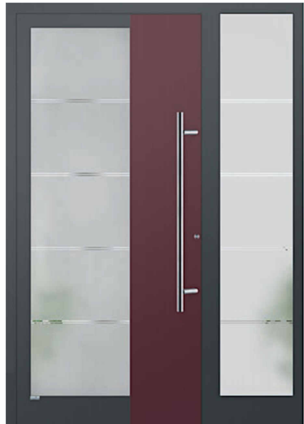
Modell Helsinki mit Seitenteil Oberfläche Glatt mit Dekorfarbe Glas TG108 Float teilmattiert Griff AG100 1000mm