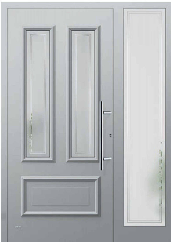
Modell Lagos mit Seitenteil Oberfläche mit Dekorrahmen Füllung aufgesetzt Glas 4G004 Float teilmattiert Griff AG60 600mm