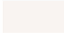
RAL9016 matt weiß