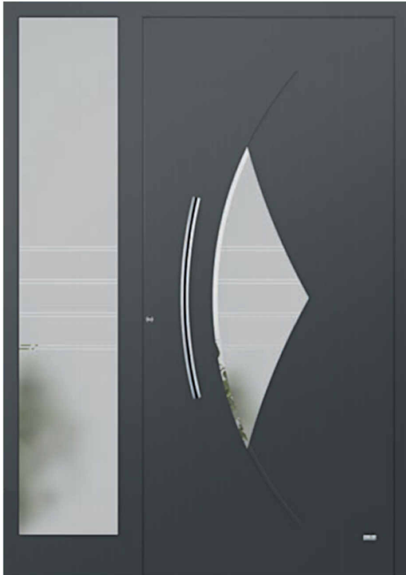
Modell Paris mit Seitenteil Oberfläche mit gefrästen Nuten Füllung aufgesetzt Glas 3G042 Float teilmattiert Griff 1701.88 (Sondergriff)