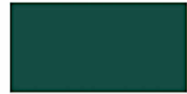
RAL6005 matt moosgrün