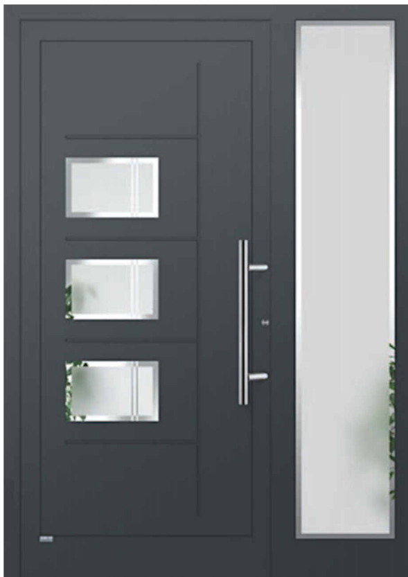
Modell Florenz mit Seitenteil gefräste Nuten in der Oberfläche, Füllung eingesetzt (aufgesetzt möglich) Glas 3G019 Float teilmattiert (Motiv) Griff: AG60 600mm