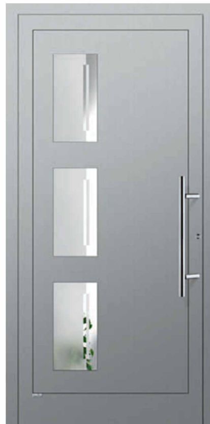
Modell Rimini glatte Oberfläche, Füllung eingesetzt (aufgesetzt möglich) Glas 3G018 Float teilmattiert (Motiv) Griff: AG60 600mm