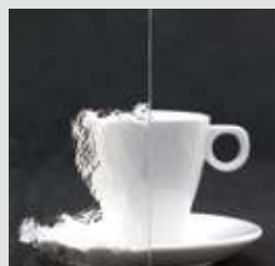
KATHEDRAL MIN WEISS