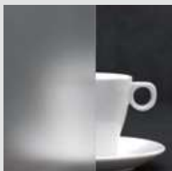
SATINATO® WEISS SATINOVO MATE WEISS