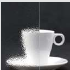
ARENA C WEISS